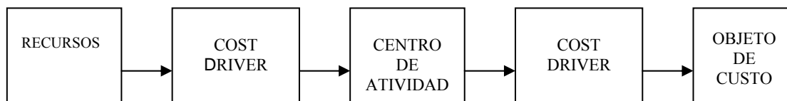
Figura 1: Distribuição de custo para objetos de custo através do ABC

A metodologia ABC estima as atividades que consome recursos e que elas são necessárias para a fabricação de produtos de prestação de serviços. Através da acumulação de custos em atividades homogêneas, é possível avaliar os custos do objeto de custo precisamente. As atividades podem ser identificadas considerando a companhia como um todo ou os departamentos, o que significa que os departamentos podem ser considerados centros de atividades. O processo de distribuição de recursos para objetos de custo pode ser representado como segue: